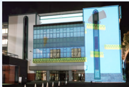
プロジェクションマッピング (動画編集・3Dモデリング)