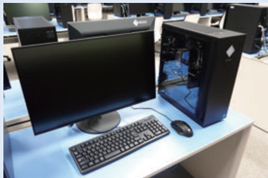
ハイスペック PC 実習 (AI・データサイエンス・プログラミング)